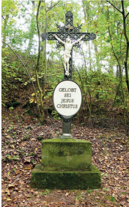
Aufnahmetag 3. 10. 2014