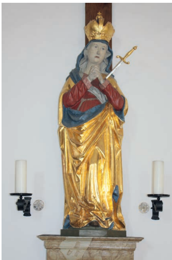
Schmerzenmutter in der Friedhofskirche

Wenn wir unsere Grafenwöhrer Kirchen besuchen, begegnen wir dem Bild Mariens in vielfacher Weise. Dabei kommt einem das Wort des Dichters Novalis in den Sinn: „Ich sehe dich, Maria, in tausend Bildern lieblich ausgedrückt; doch kein's von ihnen kann dich schildern, wie meine Seele dich erblickt“. Maria tritt uns entgegen als die hohe Frau, in der alten Pfarrkirche als himmlische Herrscherin mit Krone und Szepter, das leider abhanden gekommen ist, im rechten Seitenaltar aber auch im Rosenkranz, der von der Decke in den Kirchenraum hineinragt. In der Friedhofkirche thront Maria auf Wolken im Strahlenkranz auf dem Hauptaltar, eine der ältesten Dar-