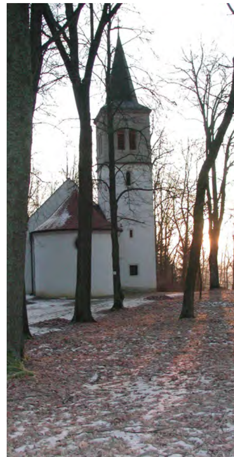
Abendstimmung auf den Anaberg in Grafenwöhr mit der Anabergkirche.

Der Kartenvorverkauf beginnt am 14.11.2016 bei Elektro Hessler und Spielwaren Gradl Grafenwöhr sowie bei der Buchhandlung Bodner in Pressath.