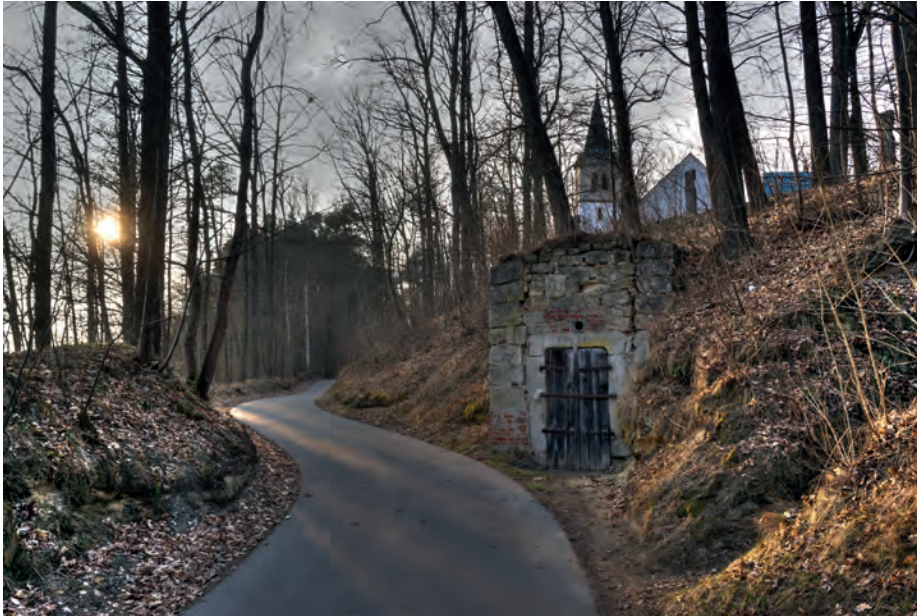
"Novemberstimmung am Annaberg" zeigt die Aufnahme von Klaus Stingl, die neben weiteren Motiven aus der Region im Heimatkalender 2017 abgebildet sind.

Motive aus der Region die von Landschaftsaufnahmen, Städtebilder, Architektur bis über das Leben und Ereignisse in der Region reichen zeigt der "Heimatkalender 2017". Zum erneuten Male legen die Fotofreunde Eschenbach-Grafenwöhr den