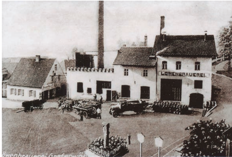
Die „Löwenbrauerei in den 1920er Jahren mit Pestsäule