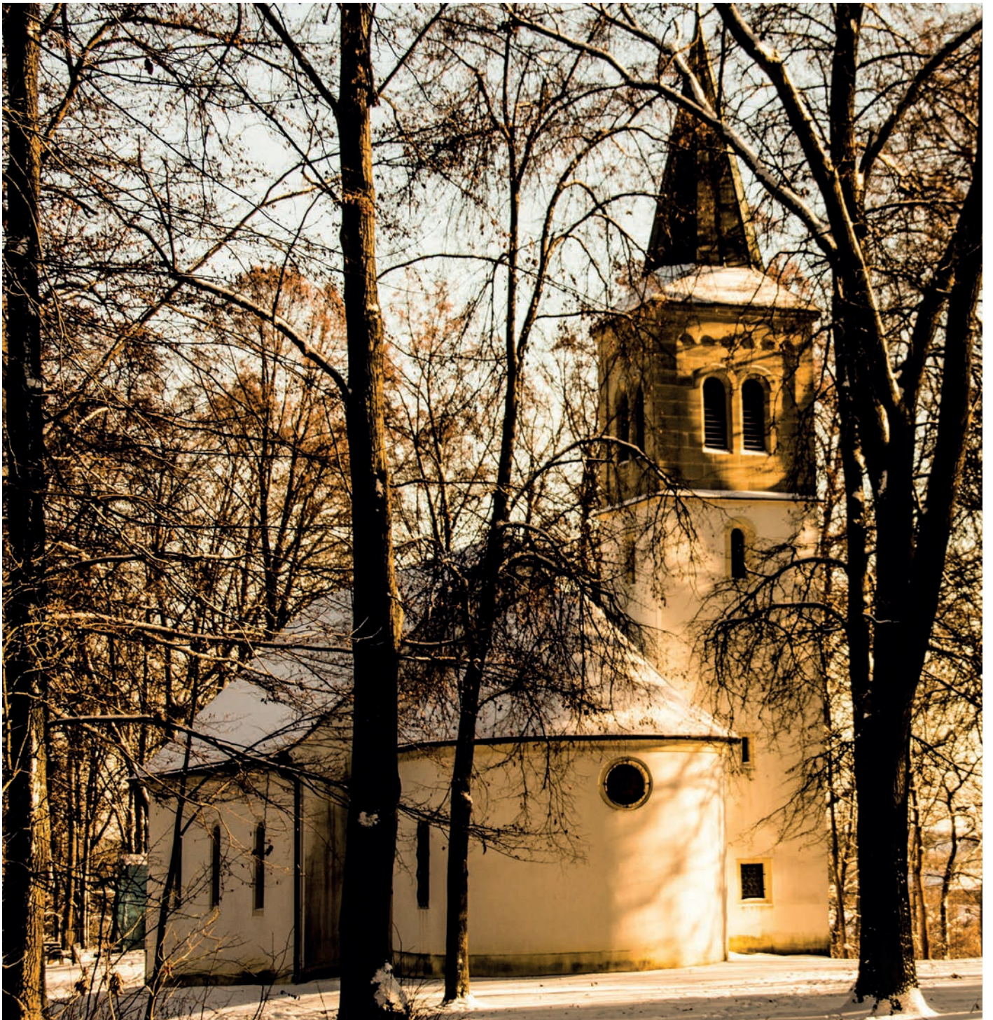
Winter am Annaberg