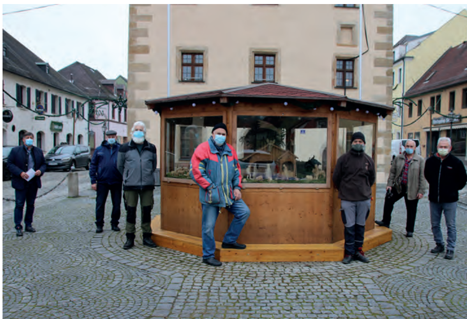
Die Schnitzergemeinschaft vor der fertigen Weihnachtskrippe mit Bürgermeister Edgar Knobloch (links)