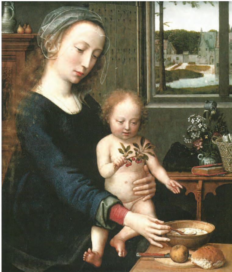
„Die Jungfrau mit der Milchsuppe“ von Gerard David

Das Werk des niederländischen Malers Gerard David beinhaltet eine zweite symbolische Ebene. Das Buch ist die Heilige Schrift. Die dunkle Schwertlilie im Keramikkrug verweist auf die Simeon-Prophezeitung. Ein Messer liegt bereit zum Teilen von Apfel und Brot. Der spitzbogige, tiefschwarze Höhleneingang verweist auf die orthodoxe Geburtshöhle und das „neue Grab“ (Joh 19,41), Kreuzblütlerblumen auf des Kindes Lebensende, die weißen Tücher im Korb auf Windel und Bestattungstuch.