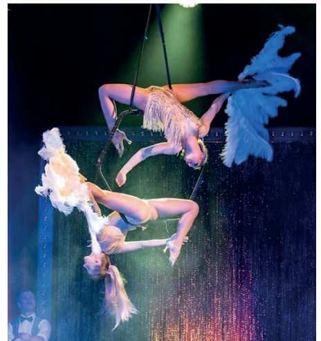
Circus of Fantasy: atemberaubende Akrobatik, Tanzeinlagen und Showeffekte im Varietésstil, Bildrechte: Dominik Halameks Circus of Fantasy