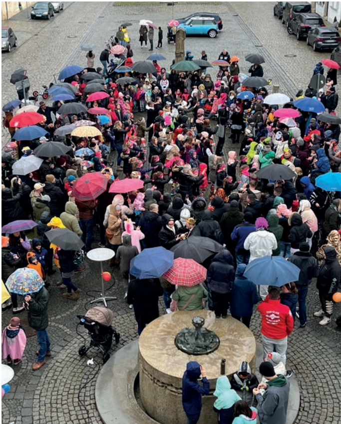
Die SV-Tanzmädels begeisterten mit ihren Darbietungen am Marktplatz die kleinen und großen Maschkerer die trotz des Regens ihren Spaß hatten.