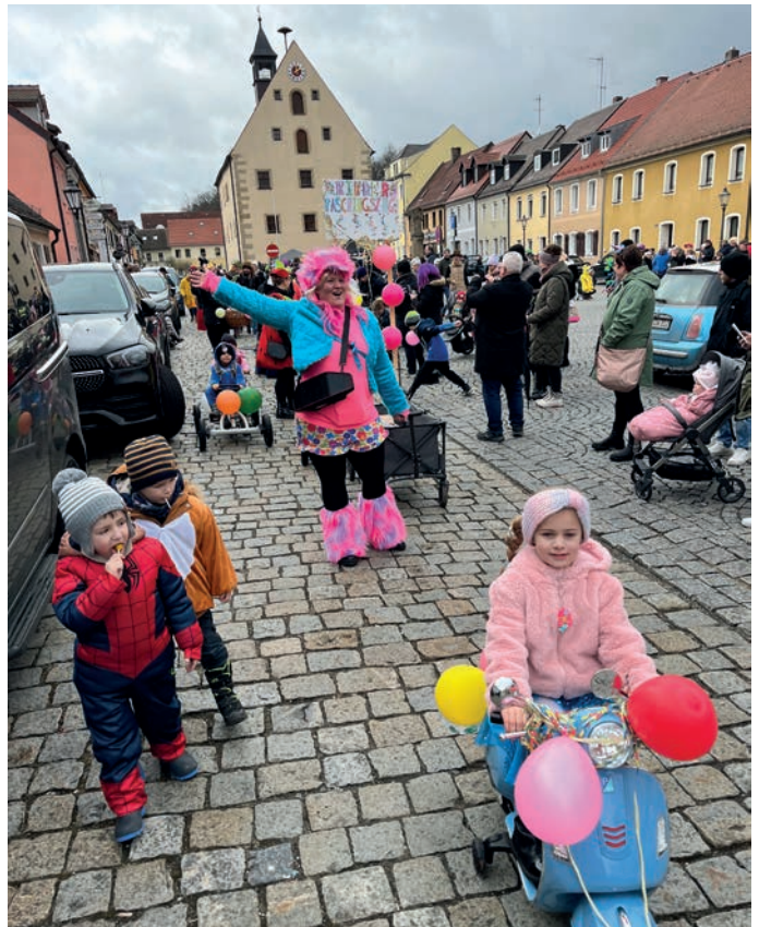
Zwei Runden ging's mit dem Kinderfaschingszug ums Rathaus.

"Grafenwöhr Helau!" hieß es am Sonntagnachmittag am Marktplatz. CSU, Frauen-Union und Junge Union hatten zum Kinderfaschingszug rund ums Rathaus geladen. Über 100 Mädchen und Buben mitsamt Eltern, Großeltern, Onkeln, Tanten und was sonst dazugehört hatte sich versammelt. Unter dem Blick von hunderten Zuschauern zogen die Kinder teilweise mit Elektro- Tretfahrzeugen und Anhängern zwei Runden um Rathaus, Markt- und Marienplatz.